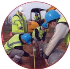
Maçon VRD canalisateur