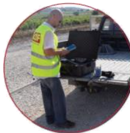
Etude des sols Essais de contrôle