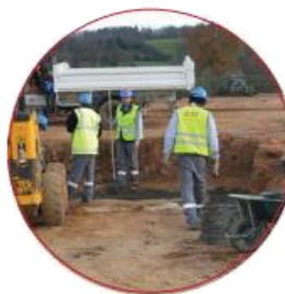
Ouvrier TP polyvalent Ouvrier routier