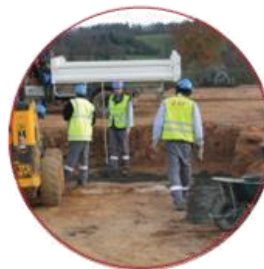
Ouvrier TP polyvalent Ouvrier routier