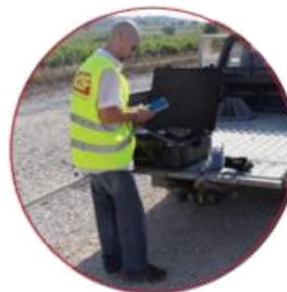
Etude des sols Essais de contrôle