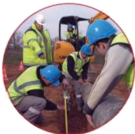
Maçon VRD canalisateur