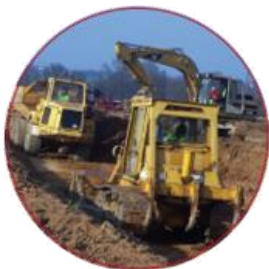
Formation initiale à la conduite d'engins de chantiers

Pour répondre à vos besoins de compétences, ODF propose des modules d'apprentissage à des métiers recherchés dans le domaine du bâtiment et des travaux publics.