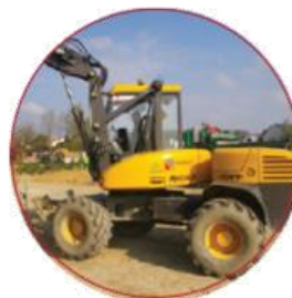
Perfectionnement à la conduite (Mécacac, Tractopelle, Niveleuse, Bull...)